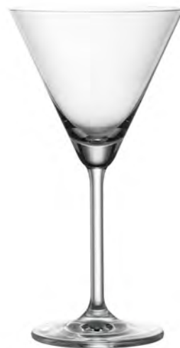
MARTINI LS12MN06 Capacity 175ml Height 173mm Packing 6/24