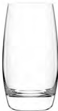
Hi Ball LT16HB10 Capacity 285ml Height 123mm Packing 6/24