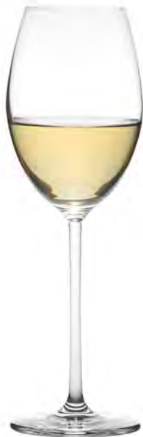
Chardonnay LS16CD14 Capacity 405ml Height 244mm Packing 6/24