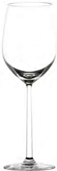
Riesling LS03RL11 Capacity 320 ml Height 225 mm Packing 6 / 24