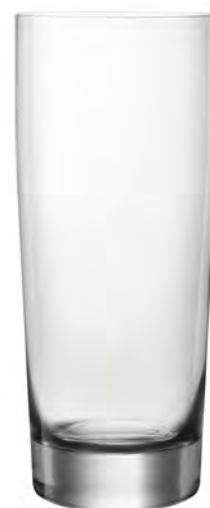
QUENCHER LT12QC21 Capacity 590ml Height 180mm Packing 6/24