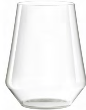
Stemless LT04SW22 Capacity 625ml Height 125mm Packing 6/24