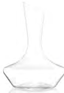
Temptation Decanter ( S )

LSG0016 Full Capacity 1,965 ml (1.0 L) Height 275.00 mm Packing 1 / 6