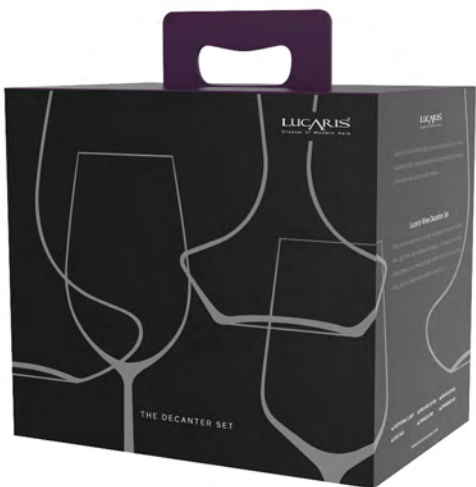
Full Capacity 1,965 ml (1.0 L) Height 275.00 mm