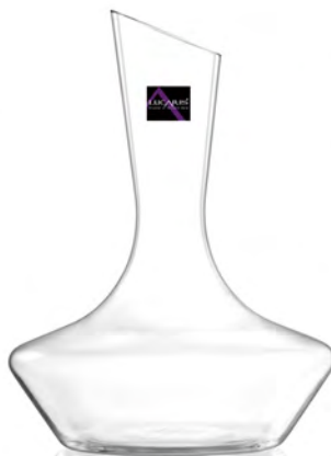
LSG0020 東京醒酒瓶禮盒組 1x3/件