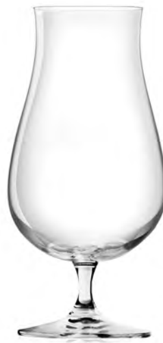
Hurricane LS14HR24 Capacity 680ml Height 199mm Packing 6/24