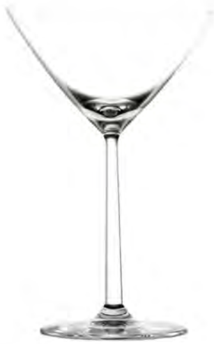
Martini LS03MN08 Capacity 230 ml Height 180 mm Packing 6 / 24