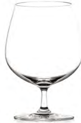
Cognac LS03CN23 Capacity 650 ml Height 156 mm Packing 6 / 24