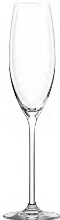
Champagne LS16CP09 Capacity 245ml Height 265mm Packing 6/24