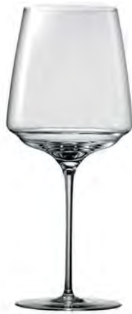
Fire LS15FE29 Capacity 830ml Height 255mm Packing 2/6