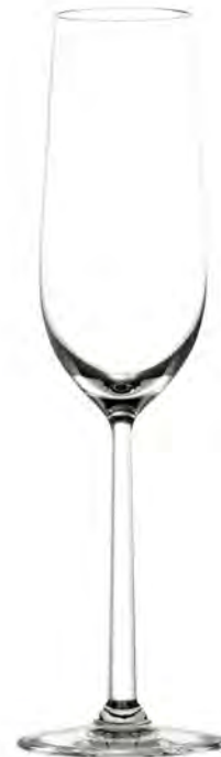
Champagne LS03CP09 Capacity 250 ml Height 265 mm Packing 6 / 24