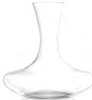
Bliss Decanter ( S )

LSG0014 Full Capacity 2,300 ml (1.0 L) Height 241.00 mm Packing 1 / 6