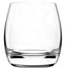
Rock LT16RK10 Capacity 275ml Height 87mm Packing 6/24