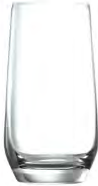
Hi Ball LT04HB10 Capacity 265ml Height 123mm packing 6/24