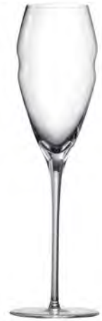
Gold LS15GD10 Capacity 275ml Height 255mm Packing 2/6