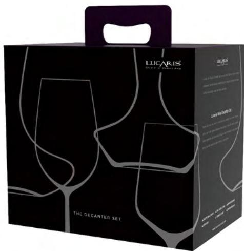
Full Capacity 2,300 ml (1.0 L) Height 241.00 mm