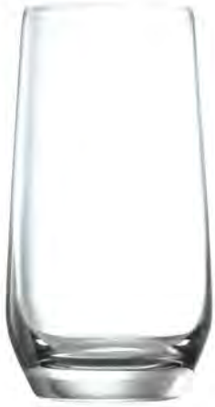
Long Drink LT04LD16 Capacity 460 ml Height 148mm Packing 6 / 24