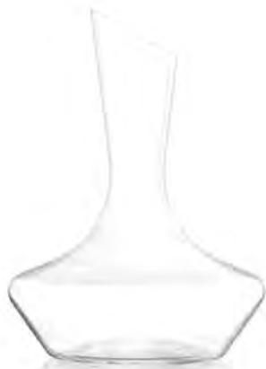
Temptation Decanter ( L )

LSG0016 Full Capacity 1,965 ml (1.0 L) Height 275.00 mm Packing 1 / 6