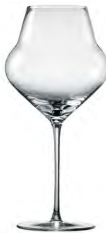
Air LS15AR26 Capacity 730ml Height 255mm Packing 2/6