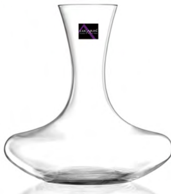
LSG0019 曼谷醒酒瓶禮盒組 1x3/件