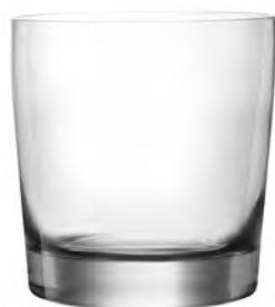
LOWBALL LT12LB14 Capacity 400ml Height 95mm Packing 6/24