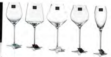
The Element Sets