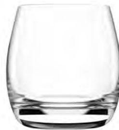
Double Rock LT16DR13 Capacity 370ml Height 92mm Packing 6/24