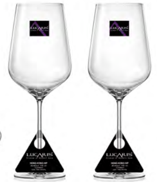
LS04BD27 Capacity 770 ml Height 275.50 mm