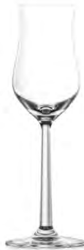
Grappa LS03GP04 Capacity 100 ml Height 192 mm Packing 12 / 24