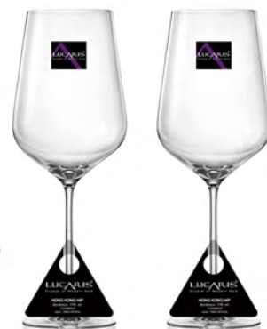
LS04BD27 Capacity 770 ml Height 275.50 mm