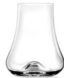
Whisky Tasting LT14WT09 Capacity 255ml Height 96mm Packing 6/24