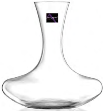
LSG0019 曼谷醒酒瓶禮盒組 1x3/件