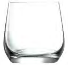
Rock LT04RK10 Capacity 280ml Height 87mm packing 6/24