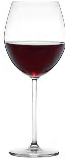
Burgundy LS16BG24 Capacity 670ml Height 249mm Packing 6/24