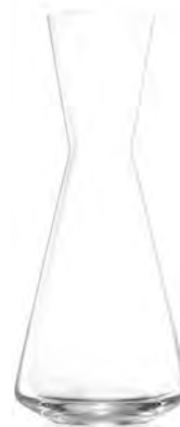
Temptation Carafe ( S )

LSG0017 Full Capacity 1,265 ml (1.0 L) Height 292.00 mm Packing 1 / 6