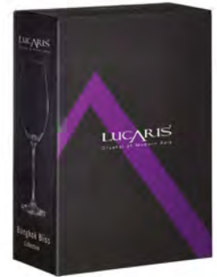
LS10RR25-2 高255mm 容700cc