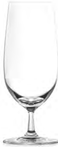
Beer LS03BR14 Capacity 395 ml Height 181 mm Packing 6 / 24