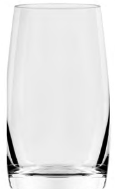
Long Drink LT14LD15 Capacity 430ml Height 130mm Packing 6/24