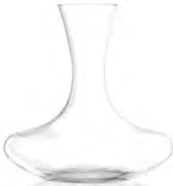
Bliss Decanter ( L )

LSG0014 Full Capacity 2,300 ml (1.0 L) Height 241.00 mm Packing 1 / 6