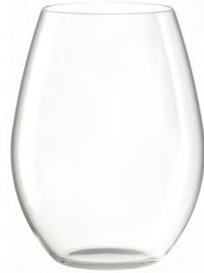
Stemless LT16SW22 Capacity 620ml Height 125mm Packing 6/24