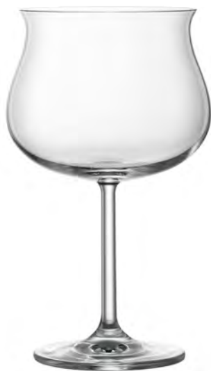
TULIP LS12TL20 Capacity 575ml Height 186mm Packing 6/24