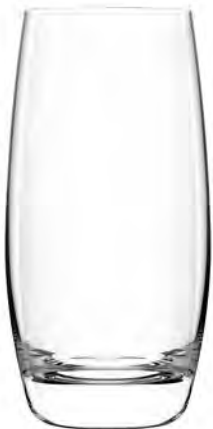
Long Drink LT16LD14 Capacity 400ml Height 144mm Packing 6/24