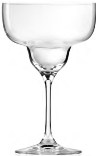
Margarita LS14MT13 Capacity 375ml Height 172mm Packing 6/24