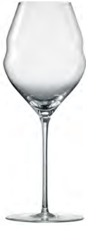
Water LS15WR20 Capacity 565ml Height 255mm Packing 2/6