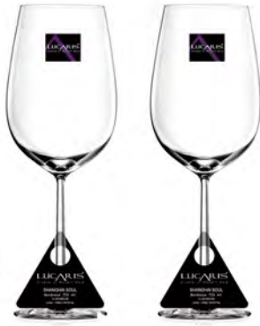
LS03BD26 Capacity 755 ml Height 275.50 mm