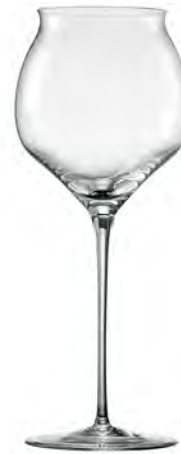
Earth LS15EH24 Capacity 690ml Height 255mm Packing 2/6