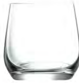
Double Rock LT04DR13 Capacity 370 ml Height 90mm Packing 6/ 24