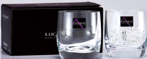
LT03DR14-2 高度：92mm 容量：395ml 2入威士忌杯禮盒