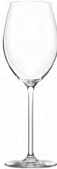
Beaujolais LS16BJ18 Capacity 520ml Height 257mm Packing 6/24