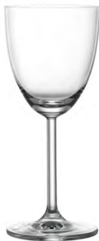
NICK & NORA LS12NR06 Capacity 175ml Height 168mm Packing 6/24