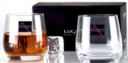
LT04DR13-2 高度：90mm 容量：370ml 2入威士忌杯禮盒