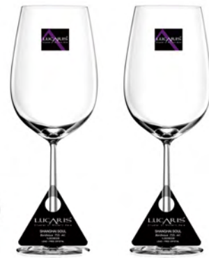
LS03BD26 Capacity 755 ml Height 275.50 mm