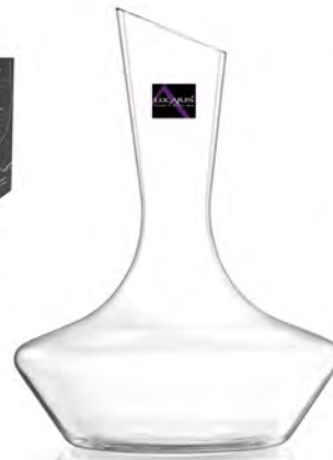
LSG0020 東京醒酒瓶禮盒組 1x3/件