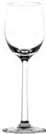
Liquer LS03LQ03 Capacity 80 ml Height 170 mm Packing 12 / 24