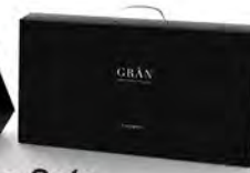
Gran Whisk Sets