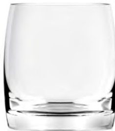
Rock LT14RK11 Capacity 320ml Height 88mm Packing 6/24