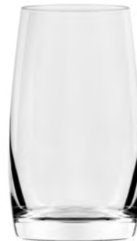
Hi Ball LT14HB10 Capacity 285ml Height 115mm Packing 6/24